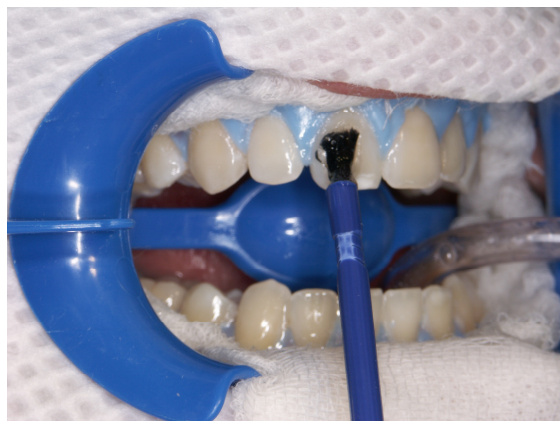
Slika 8. Nanošenje Zoom2 gela za izbjeljivanje (Discus Dental, SAD) na labijalne plohe zubi