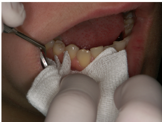
Slika 3. Uklanjanje površinskog sloja stanica sterilnom gazom s usnice