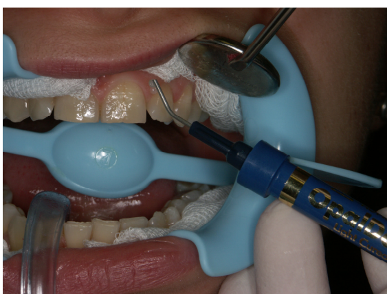
Slika 11. Izolacija gingive zaštitnim Opaldam gelom (Ultradent, SAD)