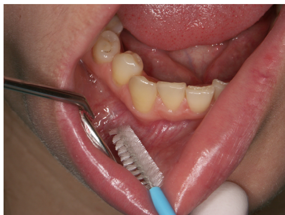
Slika 4. Uzimanje brisa s usnice