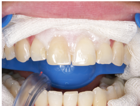
Slika 12. Izolacija gingive zaštitnim Opaldam gelom (Ultradent, SAD)