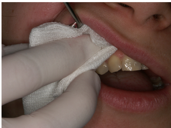
Slika 1. Uklanjanje površinskog sloja stanica sterilnom gazom s gingive