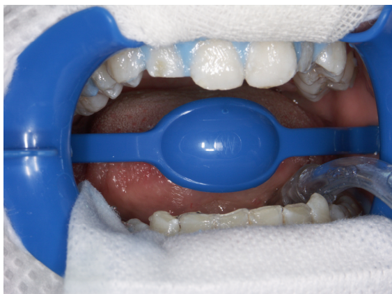
Slika 9. Gel za izbjeljivanje nanesen je na labijalne plohe zubi 14-24 i 34-44