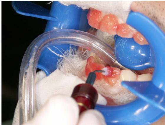
Slika 13. Nanošenje Opalescence Boost gela za izbjeljivanje (Ultradent, SAD) pomoću nastavka za aplikaciju