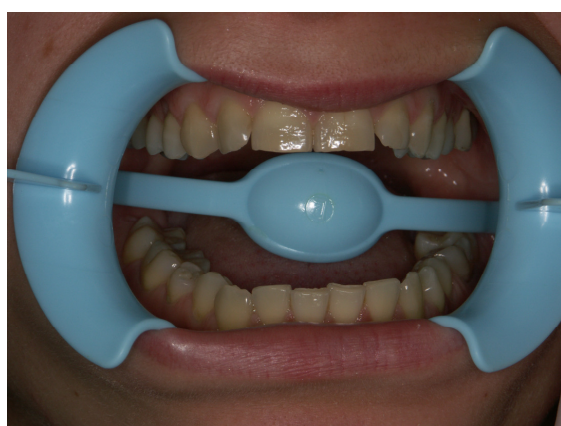
Slika 6. Postavljen retractor