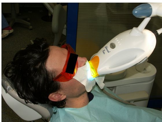
Slika 10. Osvjetljavanje zubi izvorom svjetlosti