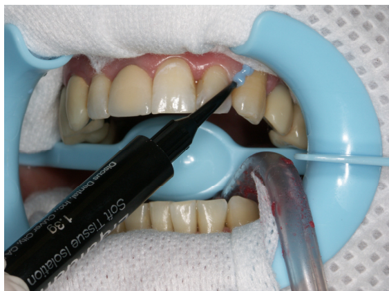
Slika 7. Izolacija gingive zaštitnim Liquidam gelom (Discus Dental, SAD)