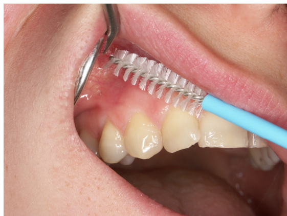
Slika 2. Uzimanje brisa s gingive