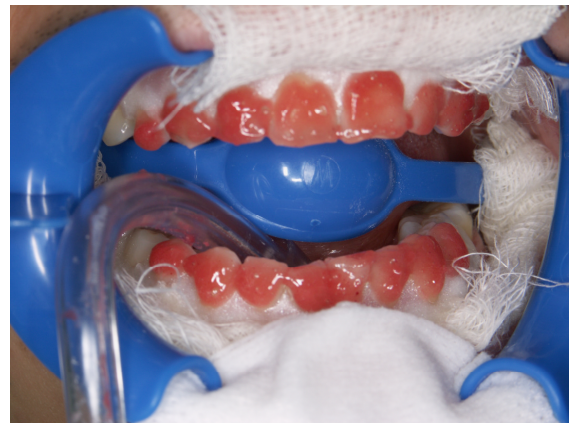
Slika 14. Gel za izbjeljivanje nanesen je na labijalne plohe zubi 14-24 i 34-44